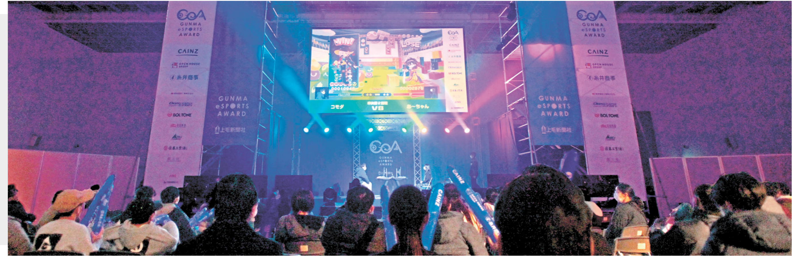
大型モニターで行われたe競技部門決勝戦に、見守られた観客の様子